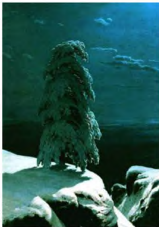
Иван Шишкин. На Севере диком... 1891

Такие задания направлены на выявление специальных предметных компетенций участников. В процессе выполнения задания необходимо провести анализ произведения, выявить его художественную идею, определить средства её реализации. В задании может быть предусмотрено проведение сравнительно-сопоставительного анализа разнородных (полярных) явлений художественной культуры. Участники олимпиады должны продемонстрировать понимание принадлежности произведения искусства той или иной национальной культуре, эпохе, художественной школе, стилю.