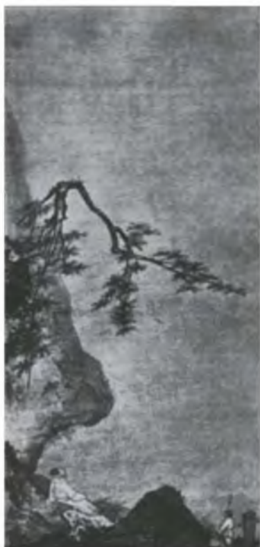
Ма Юань. Лунный свет. Живопись тушью на шелке. XII—XIII вв.